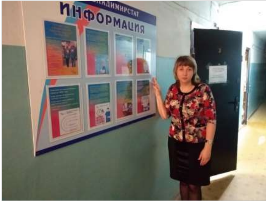
Фото: архив Владимиратата: сдается оргплан, куратор В. Шибанов, уполномоченный по вопросам ВПН Л. Шалина, инструктор Н. Гаранина

#Владимирстат #переписьнаселения #петушинскийрайон #